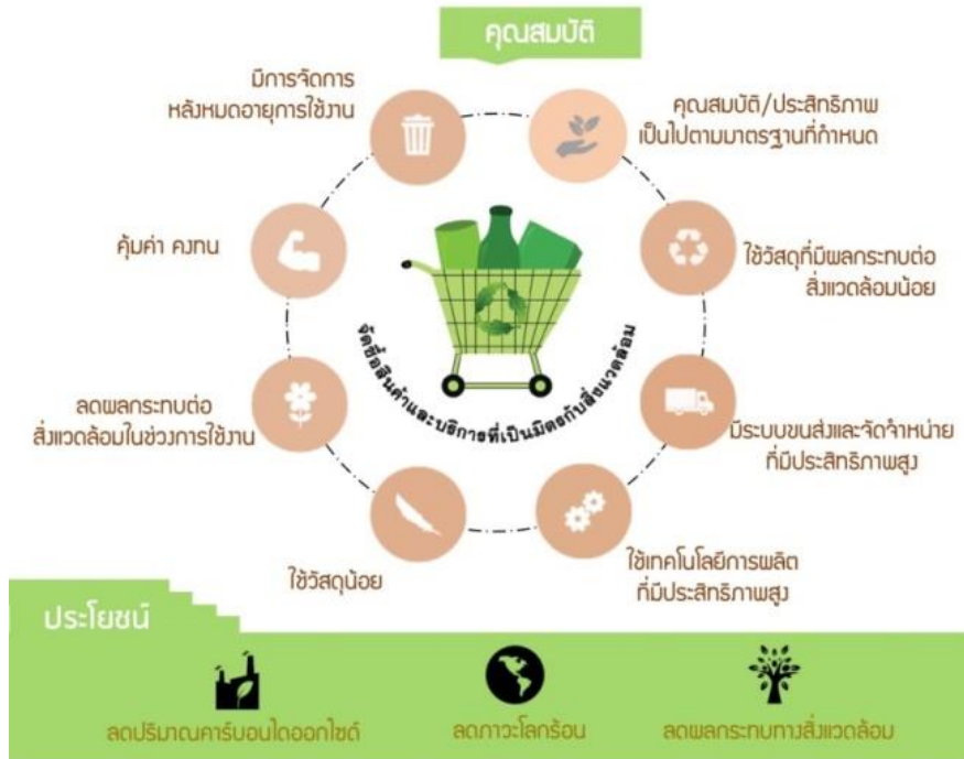
ภาพที่ 1 แสดงรายละเอียดของตะกร้าเขียว

ตะกร้าเขียว เป็นรายการสินค้าและบริการที่เป็นมิตรกับสิ่งแวดล้อม ที่ภาครัฐสนับสนุนให้มีการจัดซื้อจัดจ้าง