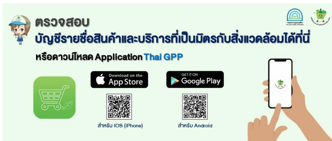
ภาพที่ 3 แสดงการตรวจสอบบัญชีรายชื่อสินค้าและบริการที่เป็นมิตรกับสิ่งแวดล้อม

1.3 บัญชีรายชื่อสินค้าและบริการที่เป็นมิตรกับสิ่งแวดล้อม ฉลากสิ่งแวดล้อม “ตะกร้าเขียว”