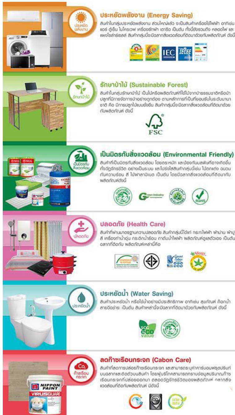
ภาพที่ 4 แสดงฉลากสินค้า รักษ์ โลก