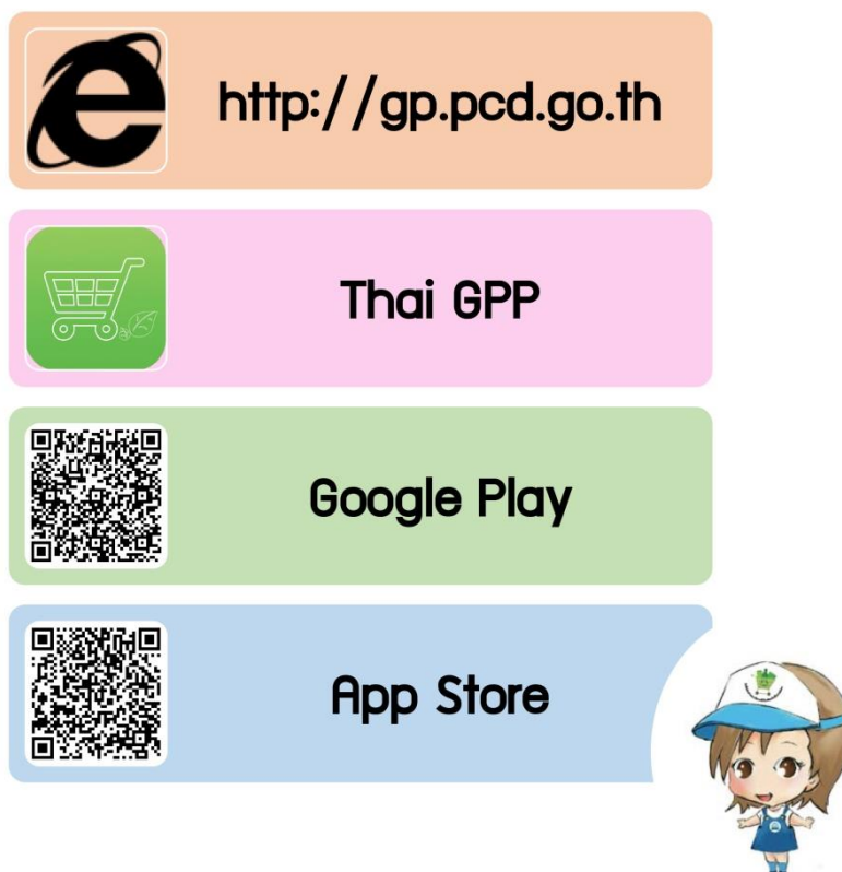
ภาพที่ 6 แสดงการเข้าถึงฐานข้อมูลสินค้าและบริการที่เป็นมิตรกับสิ่งแวดล้อม