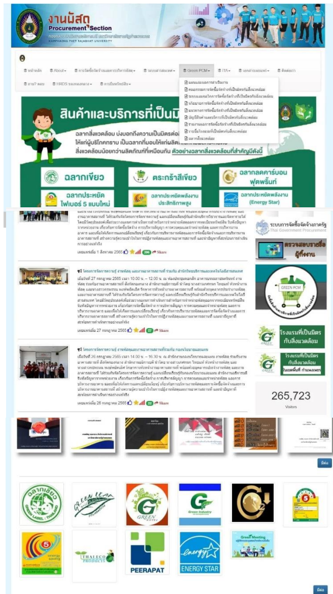
ภาพที่ 5 แสดงเว็บไซต์ งานพัสดุ กองกลาง สำนักงานอธิการบดี